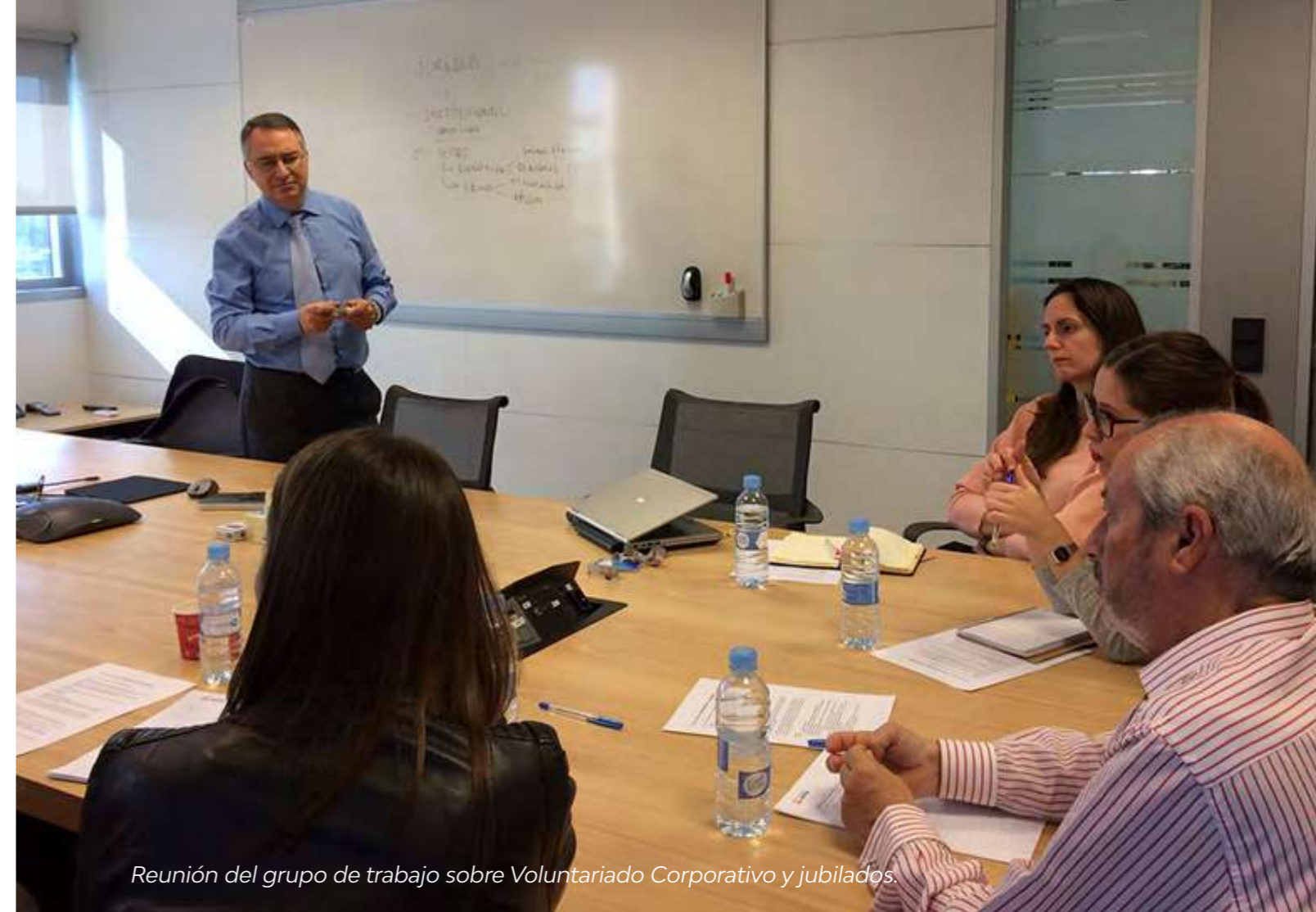
Reunión del grupo de trabajo sobre Voluntariado Corporativo y jubilados.

Aunque la jornada para jubilados sea percibida por los empleados jubilados como el verdadero lanzamiento del proyecto, desde el departamento de la empresa elegido para hacerse responsable del Programa de Voluntariado Corporativo se tienen que dar los pasos para organizar la jornada con todos los "actores" preparados para esta ocasión.