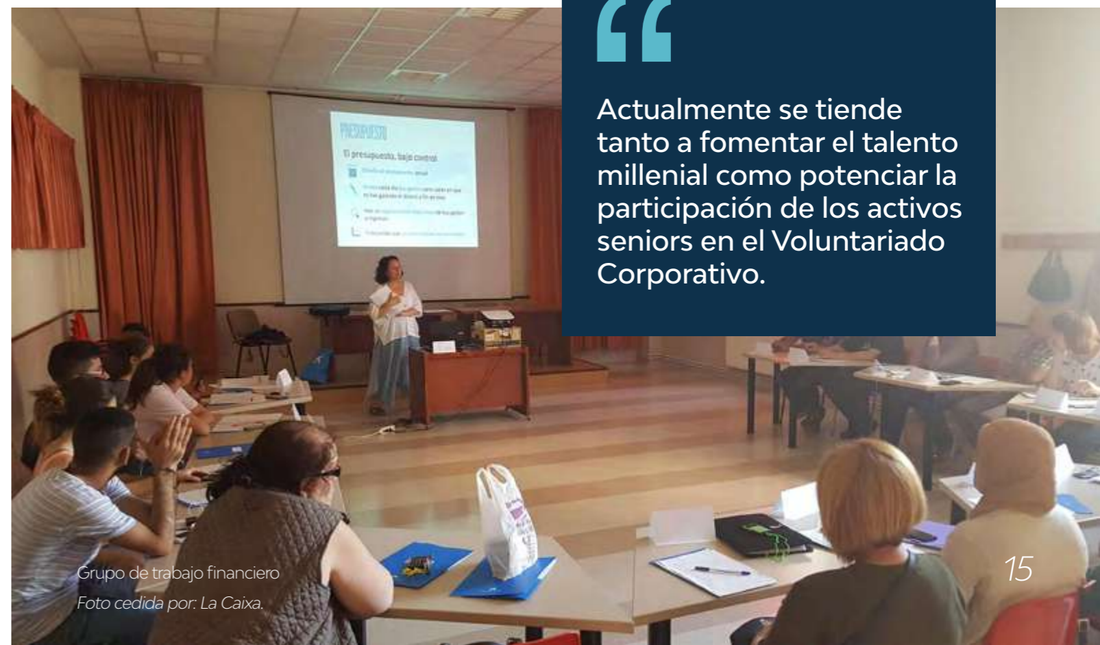
Grupo de trabajo financiero Foto cedida por: La Caixa.

Actualmente se tiende tanto a fomentar el talento millennial como potenciar la participación de los activos seniors en el Voluntariado Corporativo.