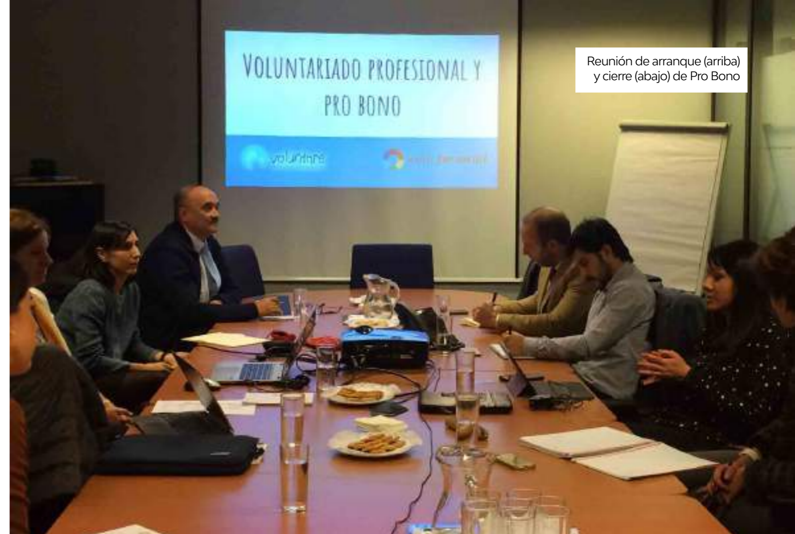
Reunión de arranque (arriba) y cierre (abajo) de Pro Bono

Así mismo, detectamos una tendencia clara dentro del voluntariado corporativo: la búsqueda para movilizar talentos y conocimientos de los empleados, promoviendo relaciones que generan beneficios a todas las partes participantes.