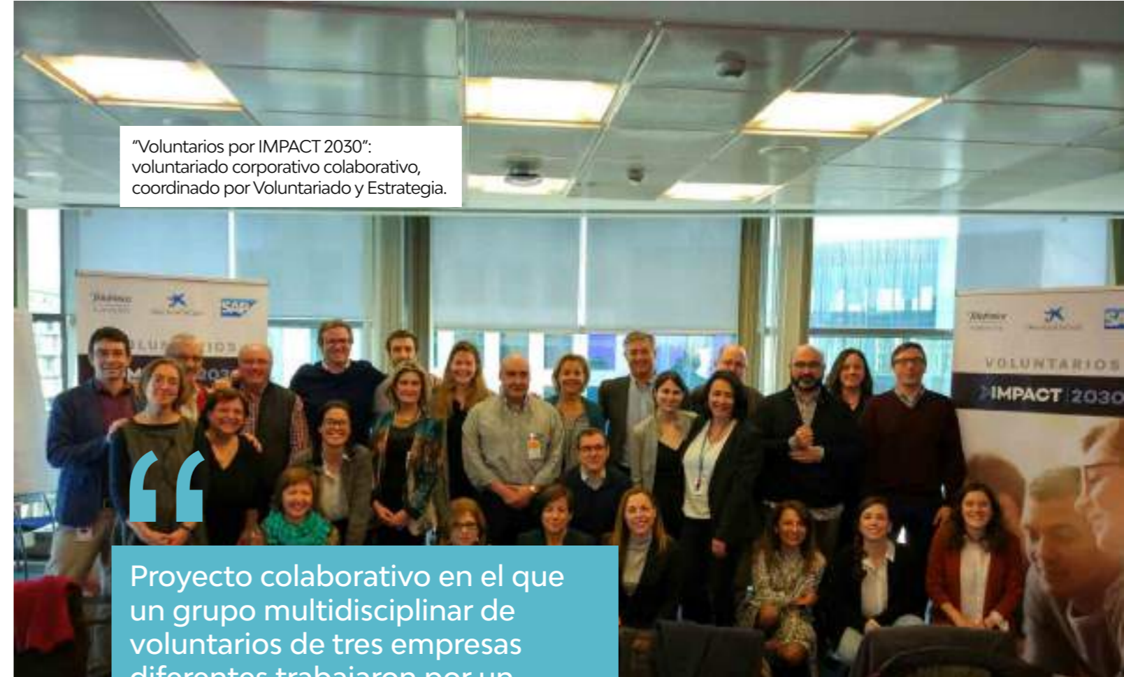
"Voluntarios por IMPACT 2030": voluntariado corporativo colaborativo, coordinado por Voluntariado y Estrategia.