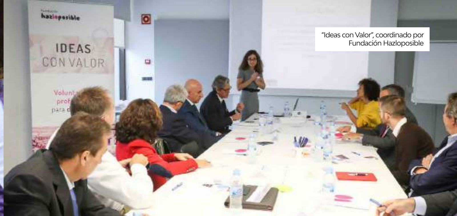
“Ideas con Valor”, coordinado por Fundación Hazloposible