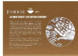
Artículos sobre el ODS y hábitos saludables