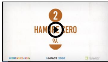
Videos formato animación