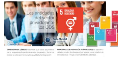
Fichas para empresas del Pacto Mundial