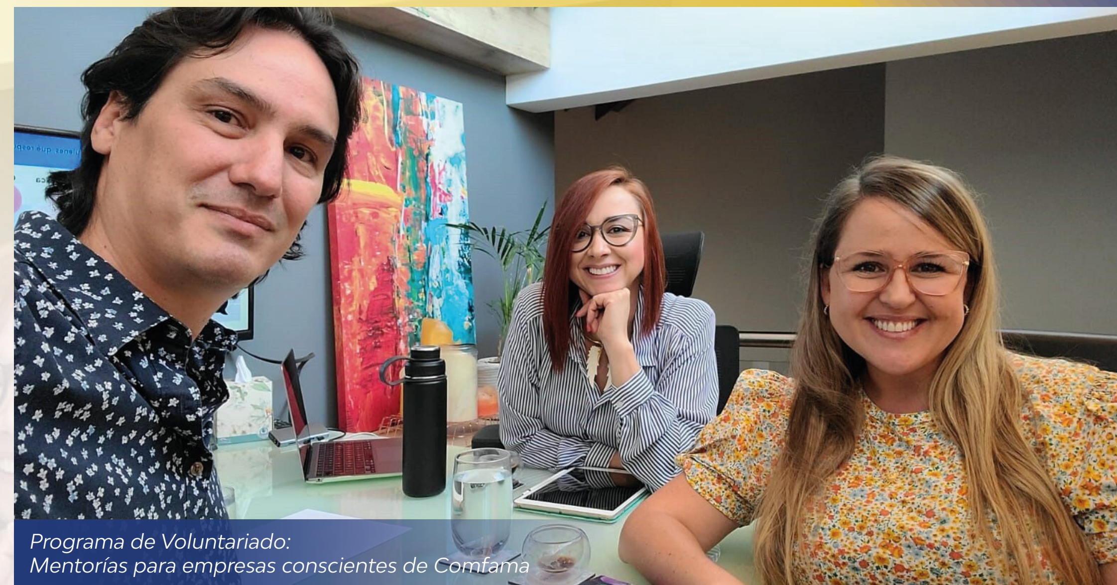
Programa de Voluntariado: Mentorías para empresas conscientes de Comfama