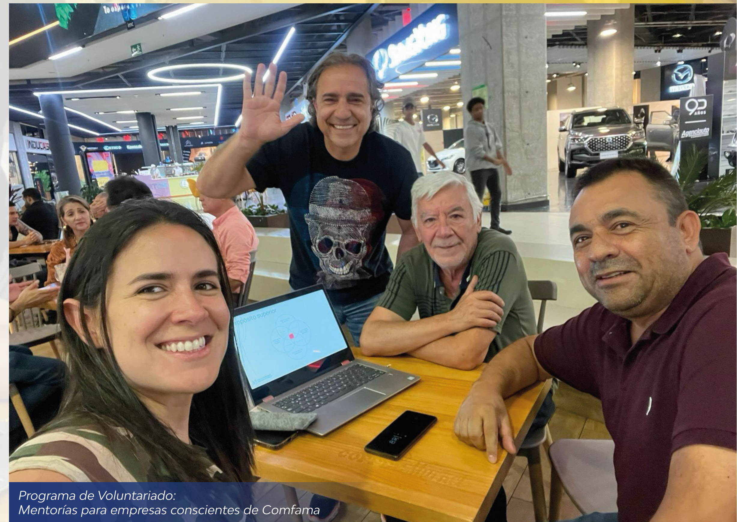
Programa de Voluntariado: Mentorías para empresas conscientes de Comfama